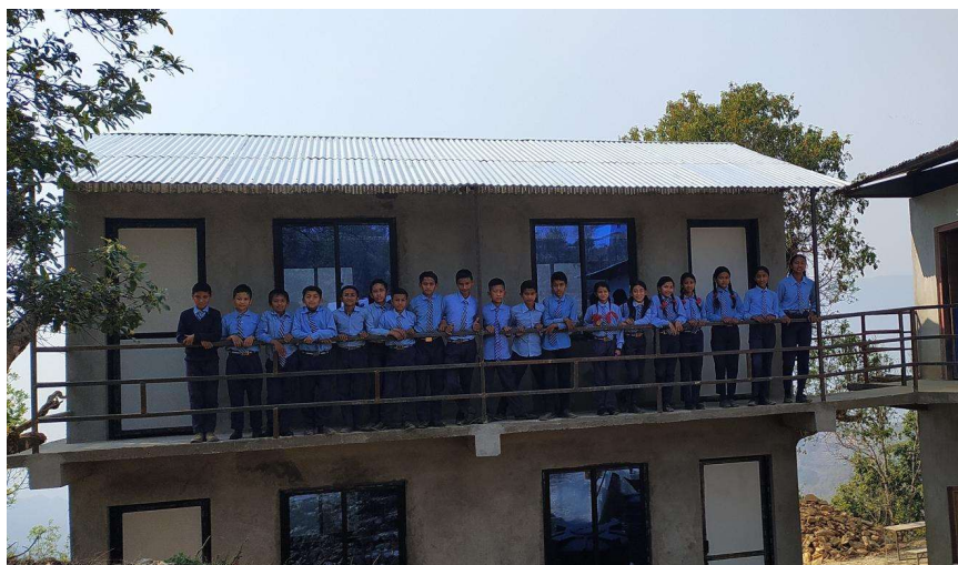
(Gebäude A mit von DHN unterstützten SchülerInnen)

Nach erfolgreichem Wiederaufbau der beim Erdbeben zerstörten fünf Schulgebäude wird das Schulprojekt an der Janata English School zum 01.07.2021 beendet.